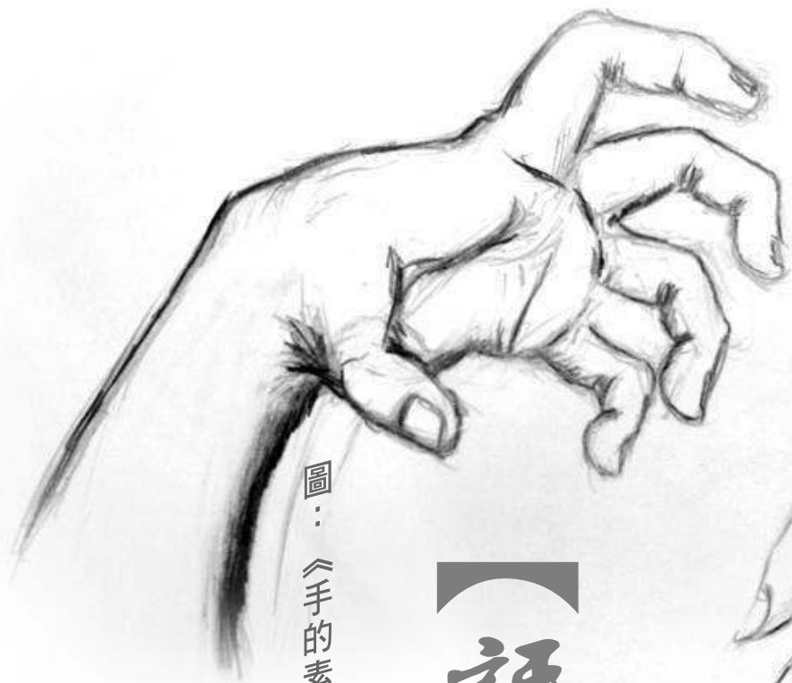
圖： 《手的素描》4D 吳俊賢