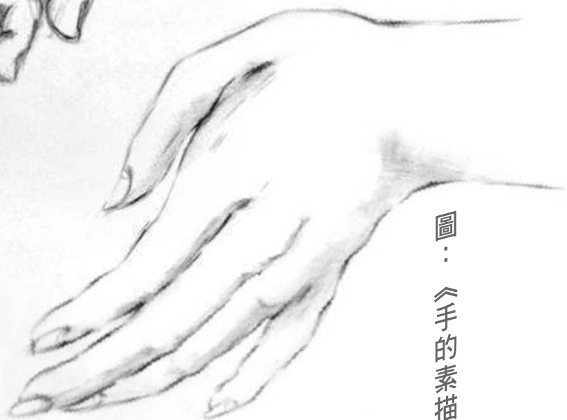
圖： 《手的素描》4B 馬珈珈