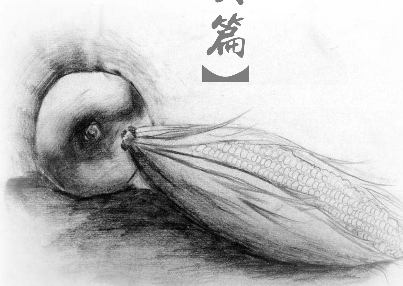
圖：《植物素描》4D 陳欣余