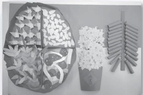
2A 周康宇 & 鍾浚傑