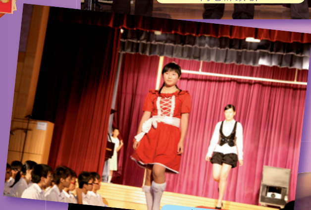
社際時裝表演比賽