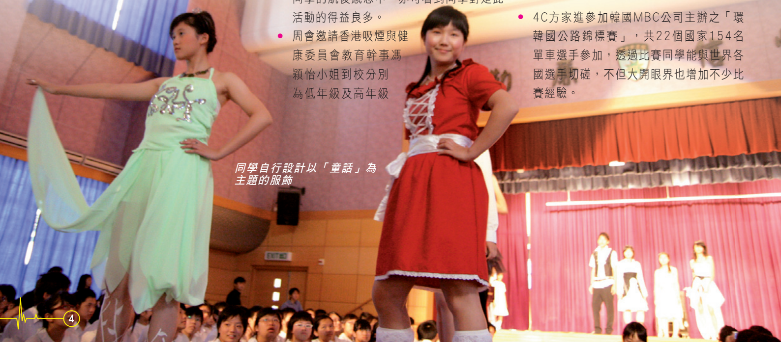
同學自行設計以「童話」為主題的服飾