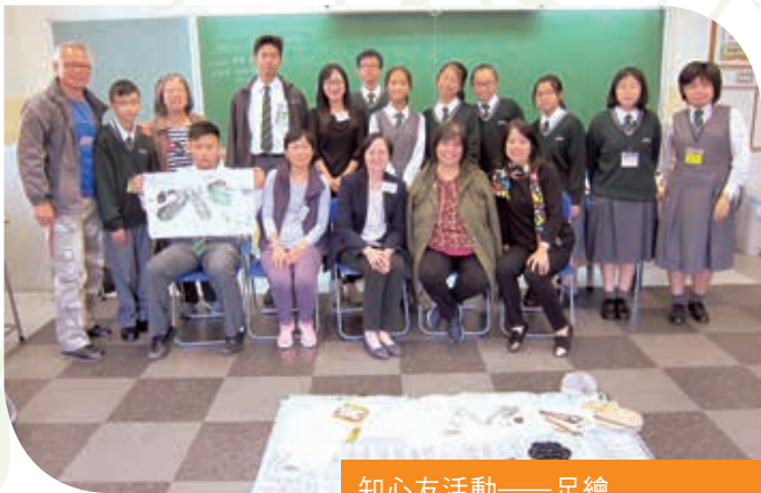
知心友活動——足繪 Foot Painting——Peers Club activity