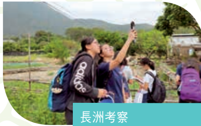
長洲考察 Field Trip to Cheung Chau

Students were arranged to take part in talks, visits and field trips to enrich their knowledge in various areas.