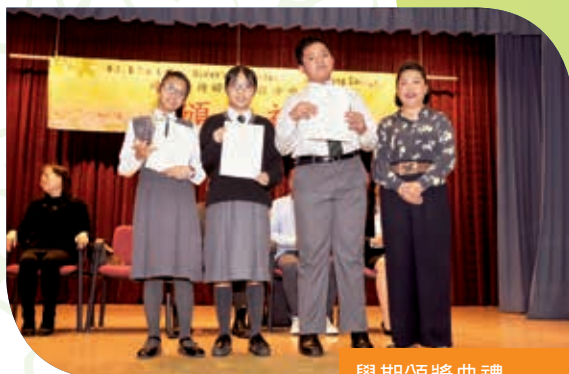
學期頒獎典禮 Prize-giving Ceremony