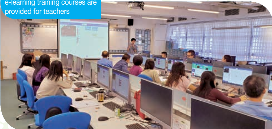
為教師提供電子教學培訓 e-learning training courses are provided for teachers