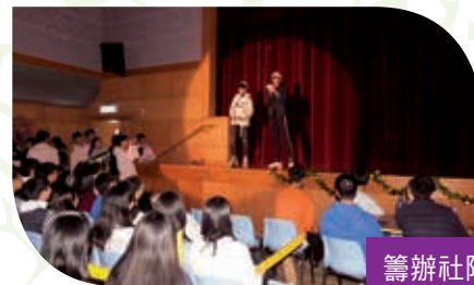
籌辦社際活動 Organization of Inter-House activities