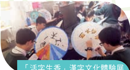
「活字生香」漢字文化體驗展 'The Vivid World of Chinese Characters: From the Origin to the Future' Exhibition