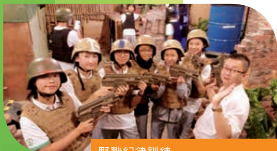
野戰紀律訓練 Discipline training through war game