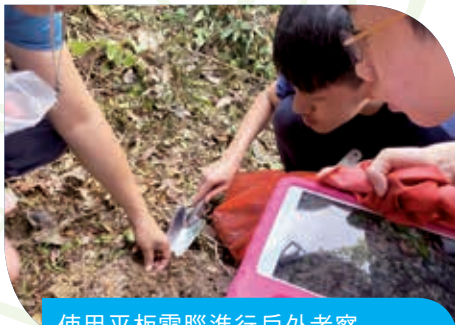
使用平板電腦進行戶外考察 Laptops are used in a field trip study