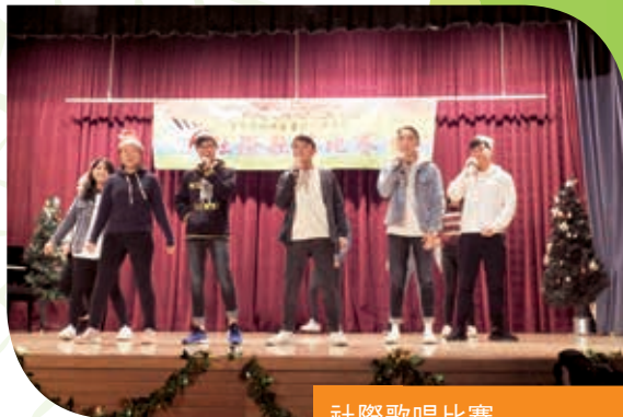
社際歌唱比賽 Inter-House Singing Contest