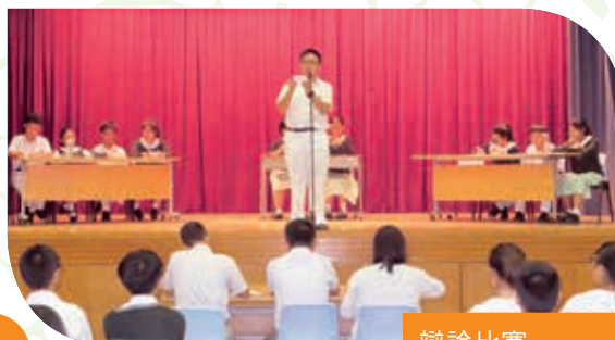
辯論比賽 Debate competition