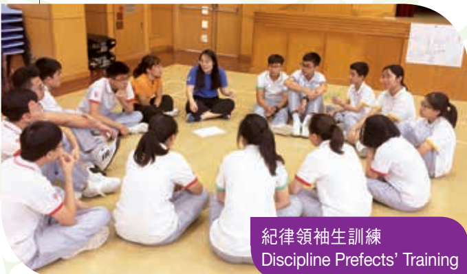
紀律領袖生訓練 Discipline Prefects' Training