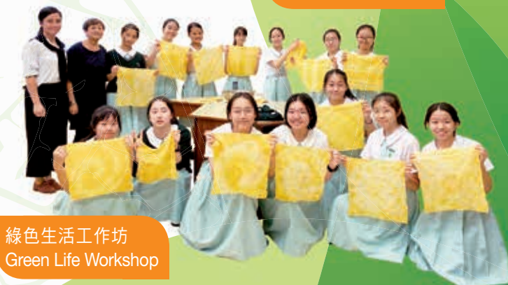
綠色生活工作坊 Green Life Workshop