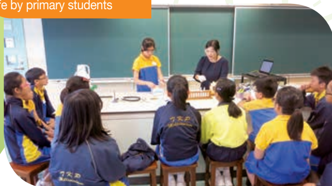
小學生體驗日 Experience secondary school life by primary students