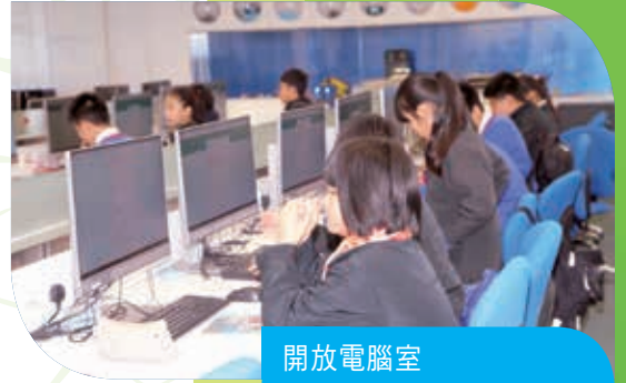
開放電腦室 Computer rooms are open to students for use