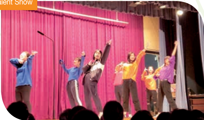
才藝表演 Talent Show