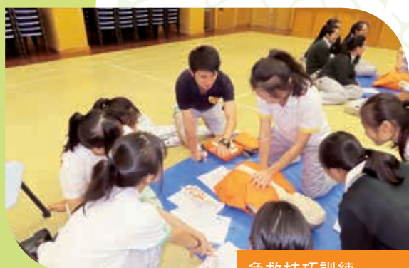
急救技巧訓練 First-aid training course