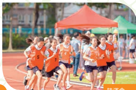
陸運會 Athletics Meet