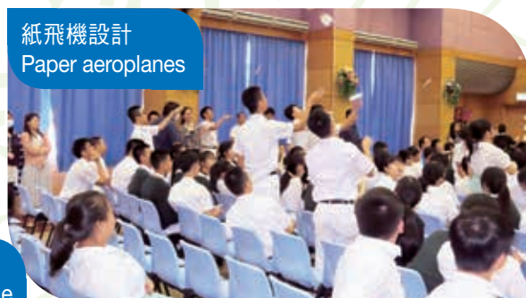
紙飛機設計 Paper aeroplanes