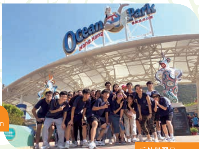
戶外學習日 Outdoor Learning Day