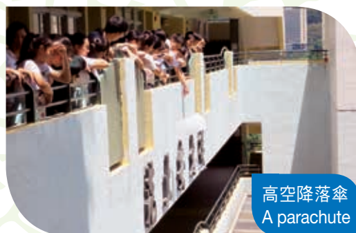
高空降落傘 A parachute