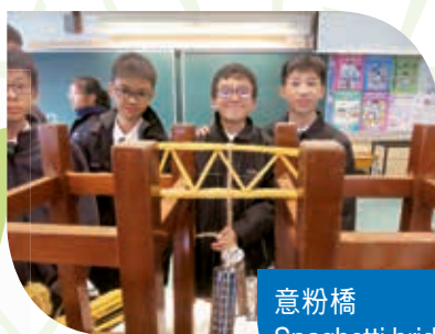
意粉橋 Spaghetti bridge