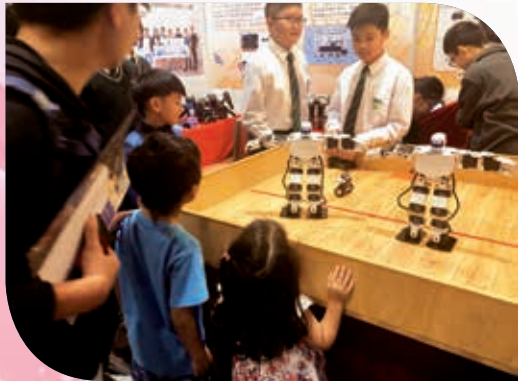
第一屆「創科@大埔」展覽會 「我最喜愛的創科作品」第三名