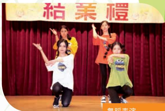
舞蹈表演 Dance performances