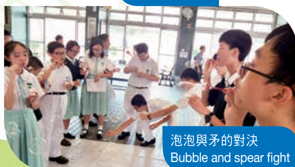
泡泡與矛的對決 Bubble and spear fight