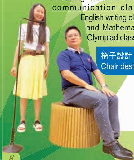
椅子設計 Chair design