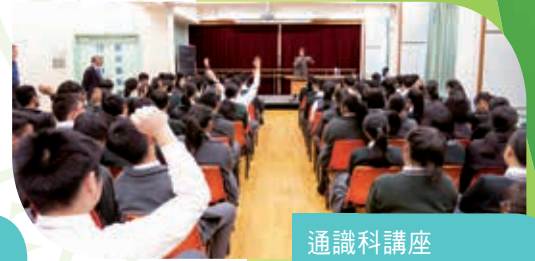
通識科講座 Talk on Liberal Studies