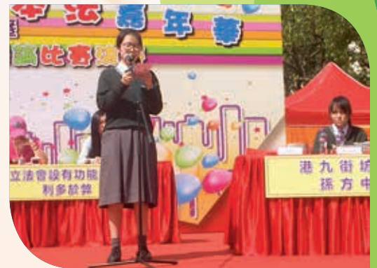
大埔區校際國民教育辯論比賽