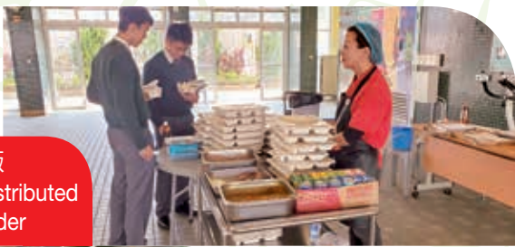
供應商分發午飯 Lunch boxes distributed by service provider