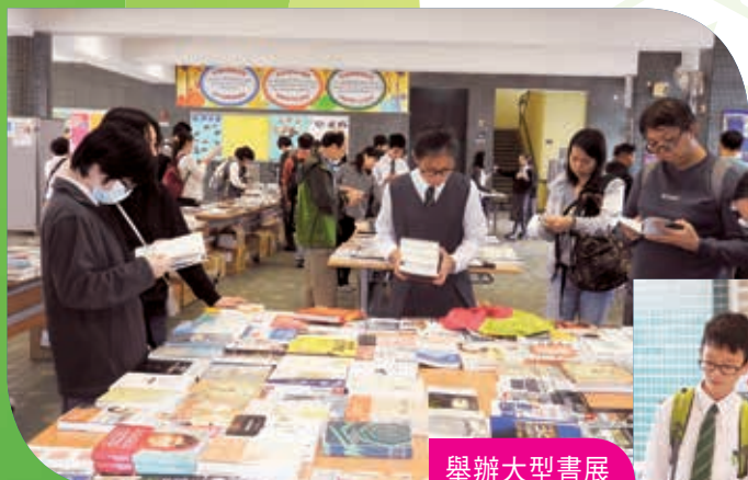
舉辦大型書展 Large book fair