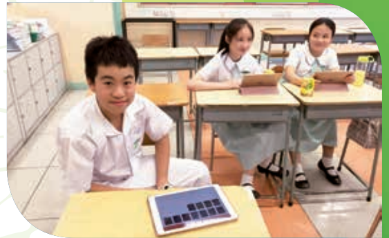
讀書會使用電子書閱讀 The members of Reading Teams are reading e-books