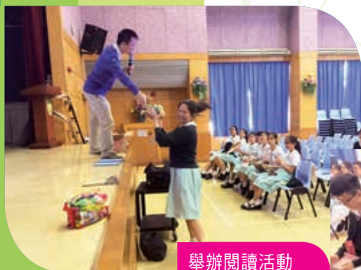
舉辦閱讀活動 Reading activities