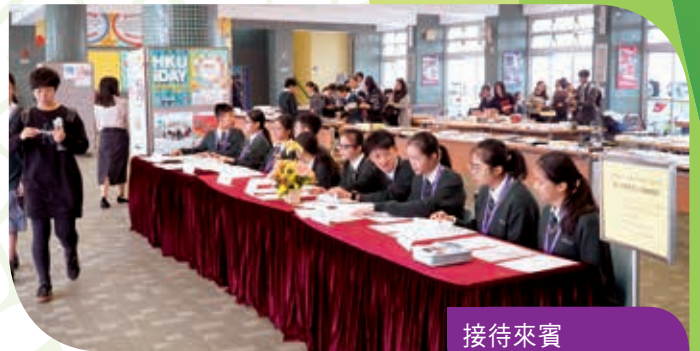
接待來賓 Reception of guests