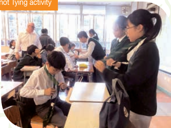
結領帶活動 Knot Tying activity