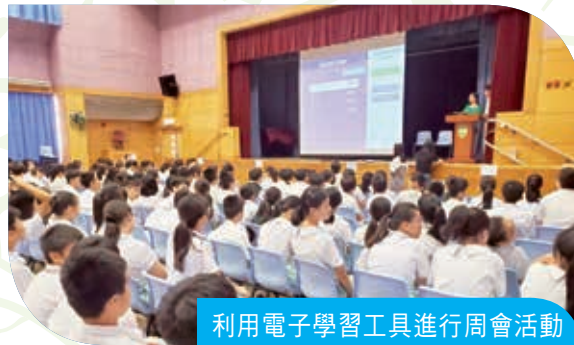
利用電子學習工具進行周會活動 e-learning tools are employed in a weekly assembly