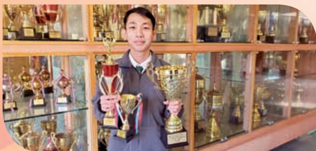
第二十二屆全港中小學中英文硬筆書法比賽