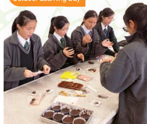
午間活動之甜心巧克力工作坊 Lunchtime activity: Chocolate making workshop