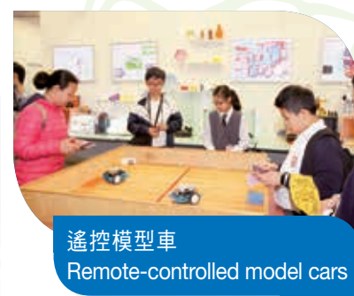
遙控模型車 Remote-controlled model cars