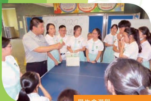
學生會選舉 Student Association Election