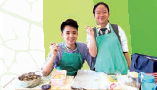
師生烹飪比賽 Teacher-student Cooking Competition