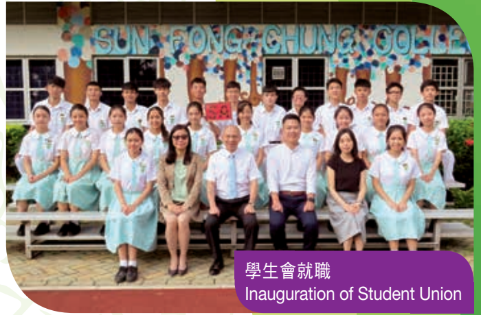
學生會就職 Inauguration of Student Union