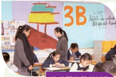
協助舉辦學科活動 Organizing activities of different subjects

We have established various student organizations to nurture student leaders. They play active roles as Student Association members, House committee members, masters of ceremonies, mentors, discipline prefects, academic prefects, promotion prefects, librarians and environmental protection prefects.