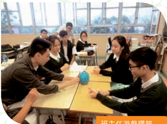
班主任遊戲環節 Playing games in class teacher periods